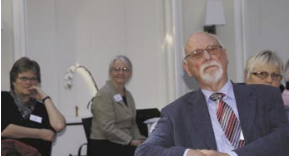
Der blev lyttet og debatteret om dilemmaet mellem det offentlige og de frivillige organisationer.

Samvirkende Menighedsplejers årsmøde havde "Frivillighed og Folkekirke" som det bærende tema. Først drøftede de fremmødte selv de udfordringer, der ligger i at virkeliggøre nye visioner for frivillighed i Folkekirken.