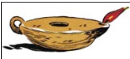
I forbindelse med Diakoniens Dag fik Glostrup Sogns Menighedspleje sit eget logo: Olielampen.